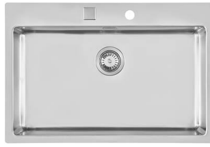
水槽 KE Filotop